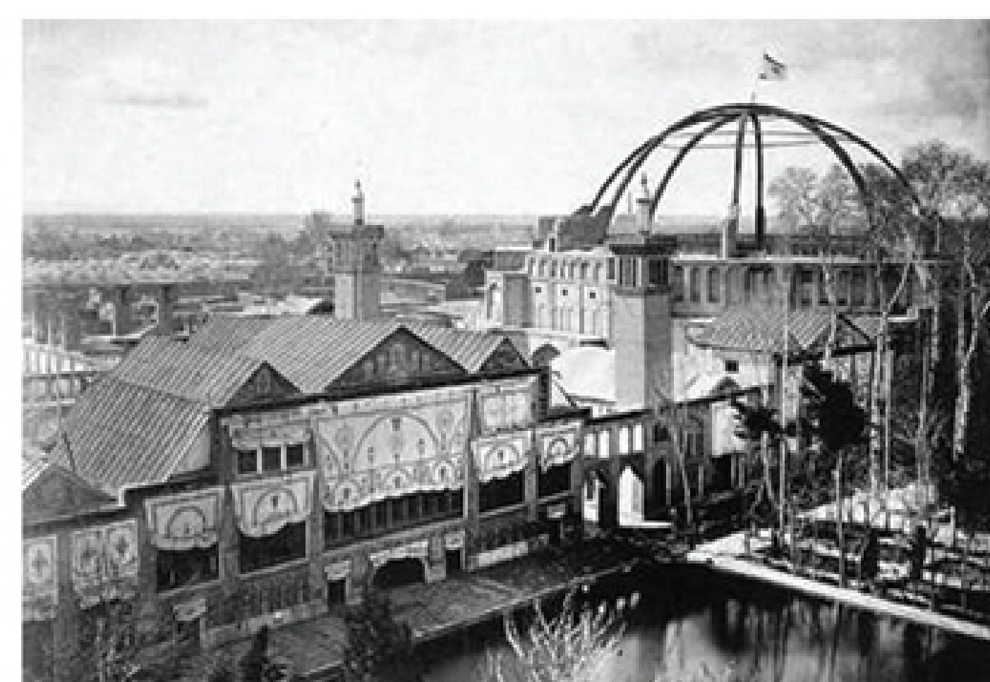
نمایی از تکیه دولت تکیه دولت، طرحی از ابو تراب غفاری چاپ شده در روزنامه شرف (دیچمه ۴-۱۲) سازه فلزی سقف تکیه دولت