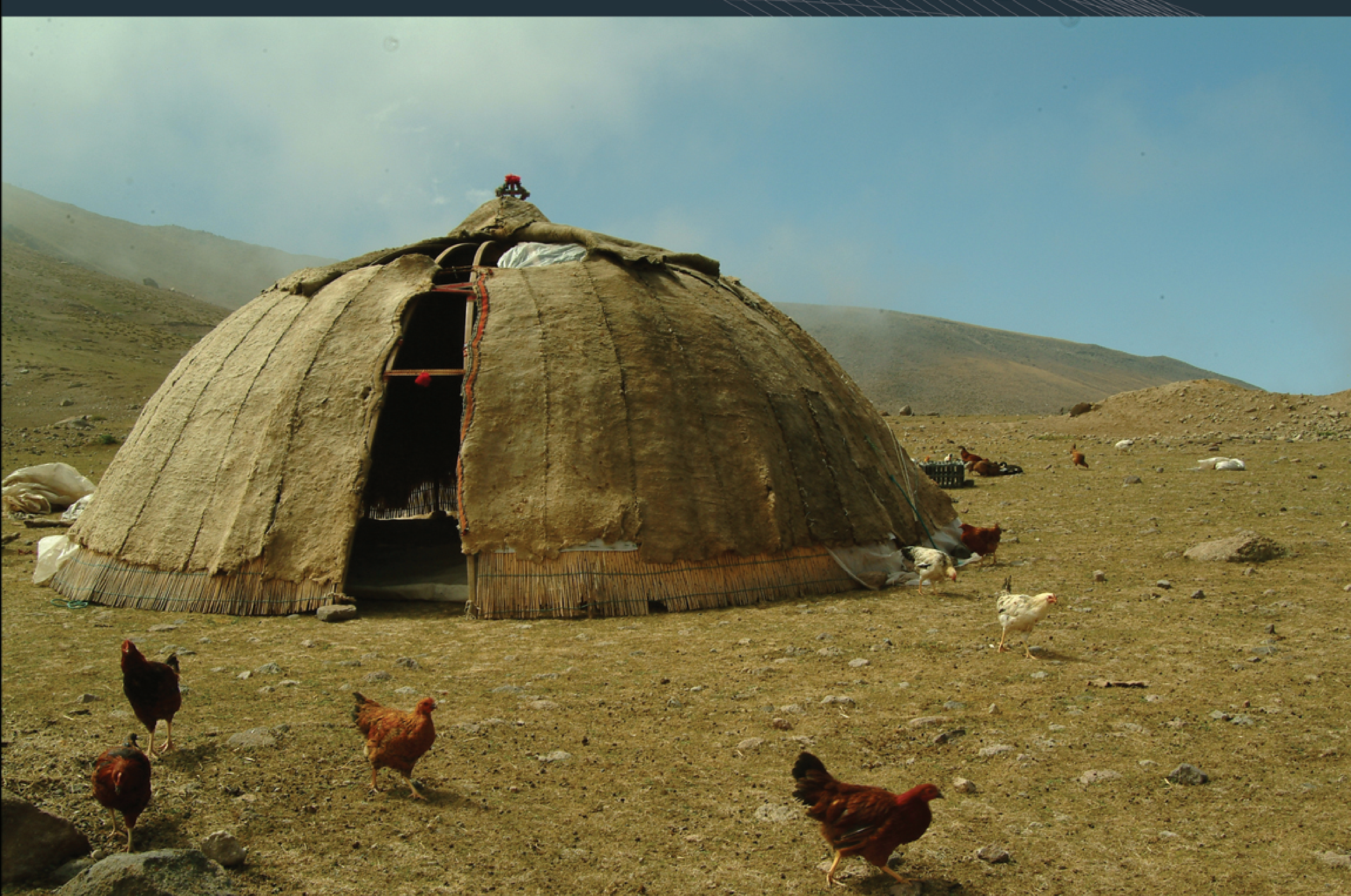
عشایر آذربایجان